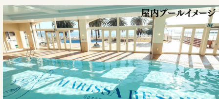
屋内プールイメージ